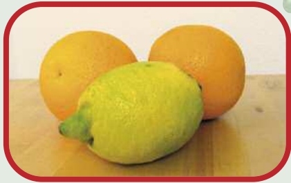
Zwei unbehandelte Orangen (aus dem Biomarkt) und eine Zitrone