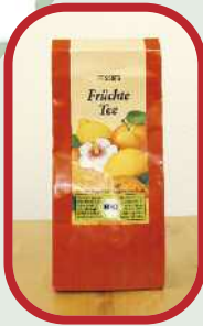
1/2 Liter Früchtetee