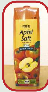
1/4 Liter Apfelsaft