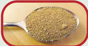
Je nach Geschmack ein bis zwei Esslöffel brauner Zucker