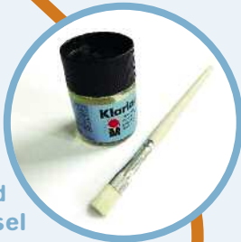
Klarlack und einen Pinsel