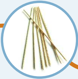
Schaschlikspieße aus Holz