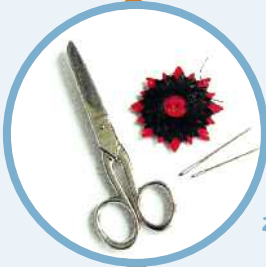
Eine Schere und Schnur zum Aufziehen