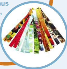
Bunte Seiten aus Zeitschriften, die ihr in 1 und 2 cm breite Streifen schneidet