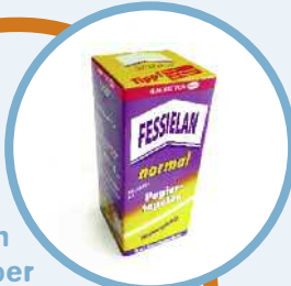
Kleister oder einen guten Alleskleber