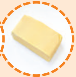
100 g Butter