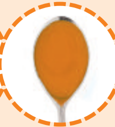
3 Esslöffel Honig