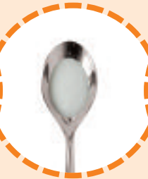
1/2 Teelöffel Natron