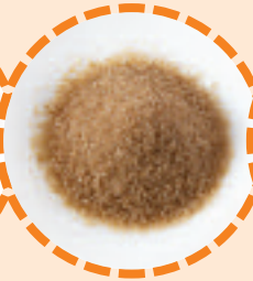
175 g brauner Zucker