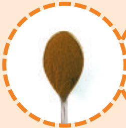
1 Teelöffel Zimt