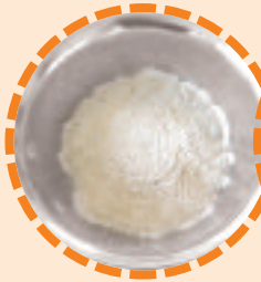
350 g Weizenmehl